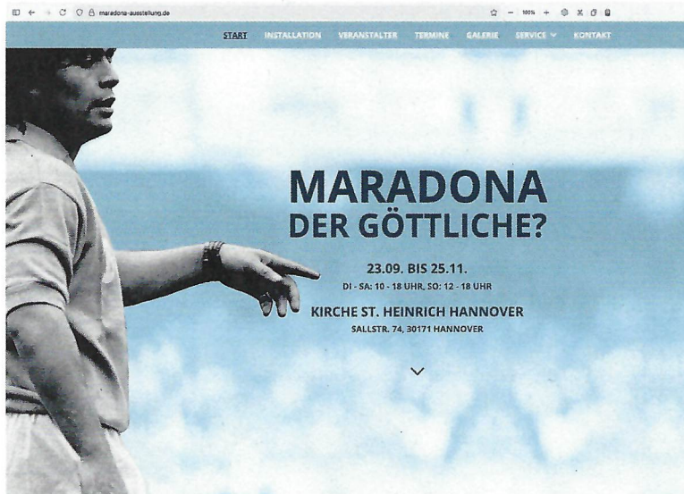
Umfassende Dokumentation der Ausstellung auf der Website https://maradona-ausstellung.de